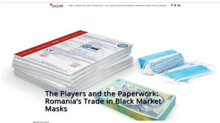
Rys. 2. Przykład artykułu śledczego zamieszczonego w ramach cyklu „Crime, corruption and coronavirus”