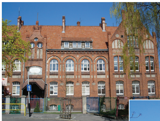
Fotografia 358. Dom przy ul. Traugutta obecnie. Widok od strony ulicy.