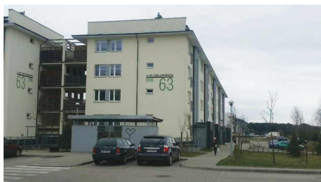
Fotografia 379. Mieszkanie usamodzielnienia przy ul. Bora-Komorowskiego 63. Widok obecny