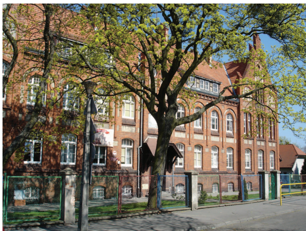
Fotografia 357. Dom przy ul. Traugutta obecnie. Widok od strony ulicy.