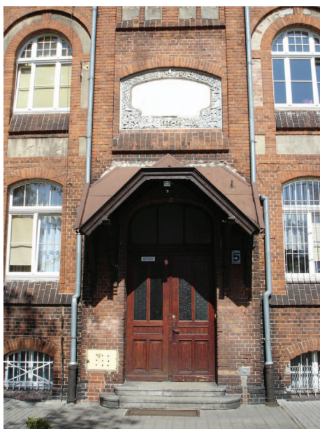
Fotografia 361. Dom przy ul. Traugutta obecnie. Wejście główne.