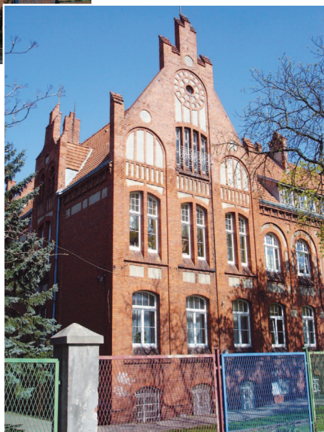
Fotografia 359. Dom przy ul. Traugutta obecnie. Widok od strony ulicy.