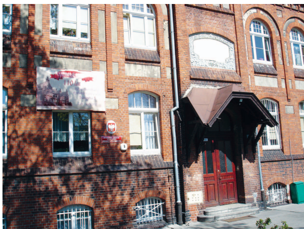
Fotografia 360. Dom przy ul. Traugutta obecnie. Widok od strony ulicy.