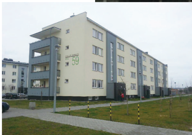
Fotografia 377. Mieszkanie usamodzielnienia przy ul. Bora-Komorowskiego 59. Widok obecny