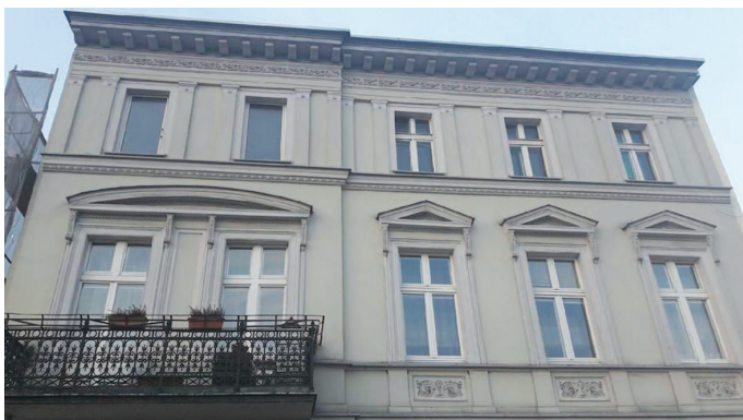
Fotografia 382. Mieszkanie usamodzielnienia przy ul. Plac Chełmiński 7. Widok obecny