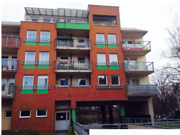
Fotografia 384. Mieszkanie usamodzielnienia przy ul. Plac Chełmiński 7. Widok obecny