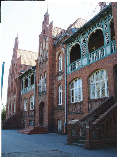
Fotografia 368. Szkoła w starej wozowni przy ul. Traugutta. Widok obecny.