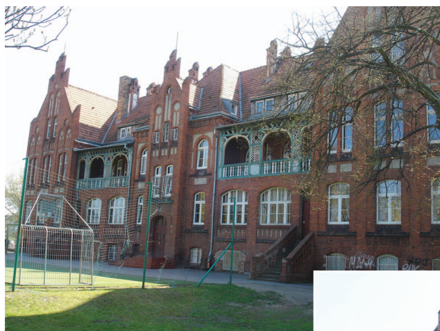
Fotografia 366. Dom przy ul. Traugutta obecnie. Widok od strony boiska i ul. Wiatrakowej.