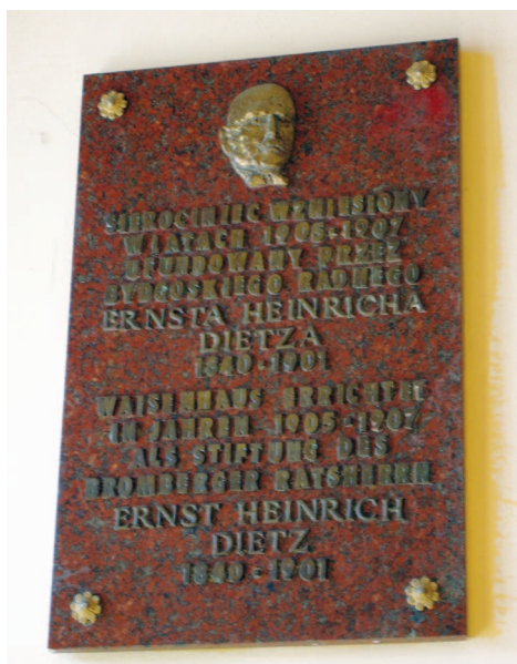
Fotografia 362. Tablica pamiątkowa ku czci H. Dietza w przedsinieku Domu przy ul. Traugutta.