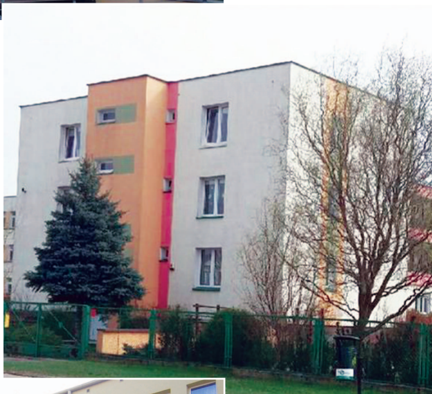
Fotografia 385. Mieszkanie usamodzielnienia przy ul. Popiełuszki