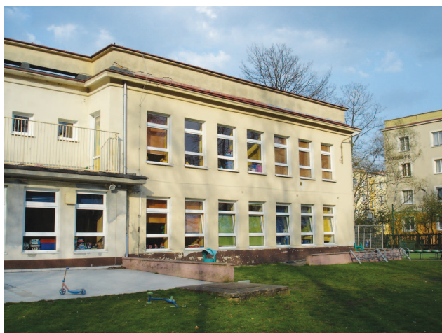
Fotografia 372. Dom Małego Dziecka „Filipek” przy ul. Stolarskiej. Widok od strony placu zabaw.