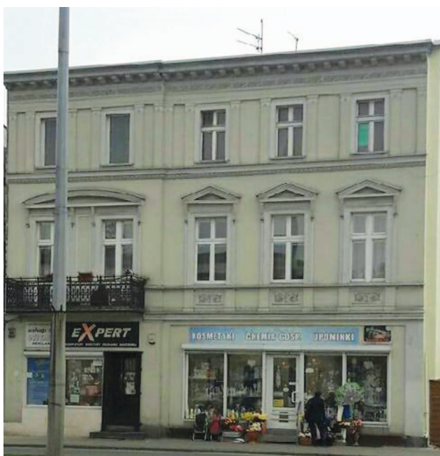
Fotografia 380. Mieszkanie usamodzielnienia przy ul. Grunwaldzkiej 49. Widok obecny