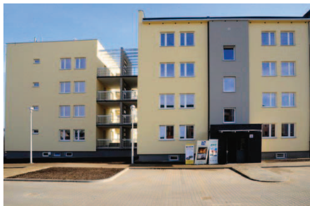
Fotografia 374. Mieszkanie usamodzielnienia przy ul. Bora-Komorowskiego 22. Widok obecny