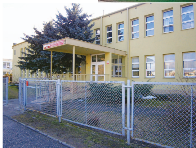
Fotografia 386. Hostel BZPOW przy ul. Dunikowskiego