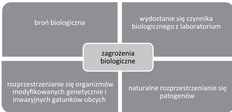
Schemat 1. Składniki bezpieczeństwa biologicznego

Bezpieczeństwo biologiczne najczęściej analizowane jest przez pryzmat bioterroryzmu, wytycznych w zakresie zapewnienia odpowiednich procedur w laboratoriach chroniących przed niekontrolowanym przedostaniem się czynników biologicznych na zewnątrz oraz wprowadzaniem do środowiska organizmów modyfikowanych genetycznie.