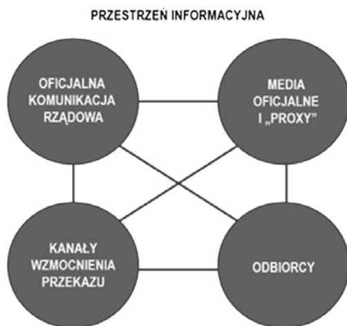
Rys. 1. Rosyjski ekosystem dezinformacji i propagandy

zwierciadła zarówno źródła dezinformacji i propagandy – oficjalne oświadczenia rządowe, finansowane przez państwo media, „proxy” strony internetowe, boty, fałszywe postacie w mediach społecznościowych, operacje dezinformacyjne z wykorzystaniem cyberprzestrzeni itd. – jak i różne taktyki stosowane przez te kanały. Co więcej, nie ma jednej platformy medialnej, na której rozpowszechniana jest propaganda i dezinformacja, jak i nie ma też jednorodności komunikatów w różnych źródłach (Targalski, 2020).