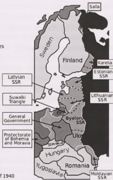
Mapa 3. Zmiany terytorialne w Europie Wschodniej w latach 1939–1941