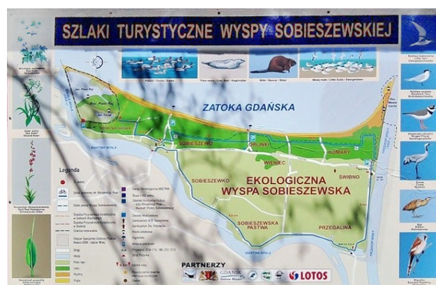
Рис. 1. Информационный щит

Дидактические тропы способствуют познанию природных богатств и культурных достижений конкретной местности, а также интегрируют знания, полученные ранее в школе или из средств массовой информации (книг, газет, телевидения, Интернета).