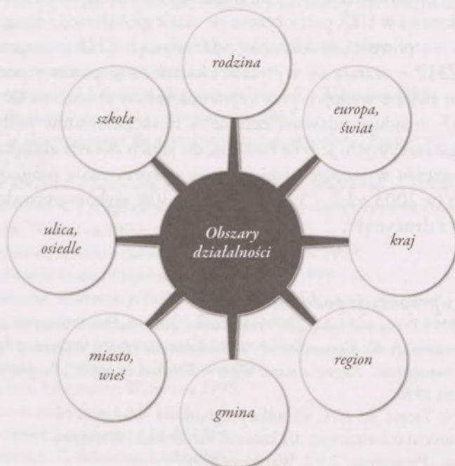
Rysunek 3. Obszary działalności jednostek barcerskich realizujących programy ZHP w latach 1995--2008 12