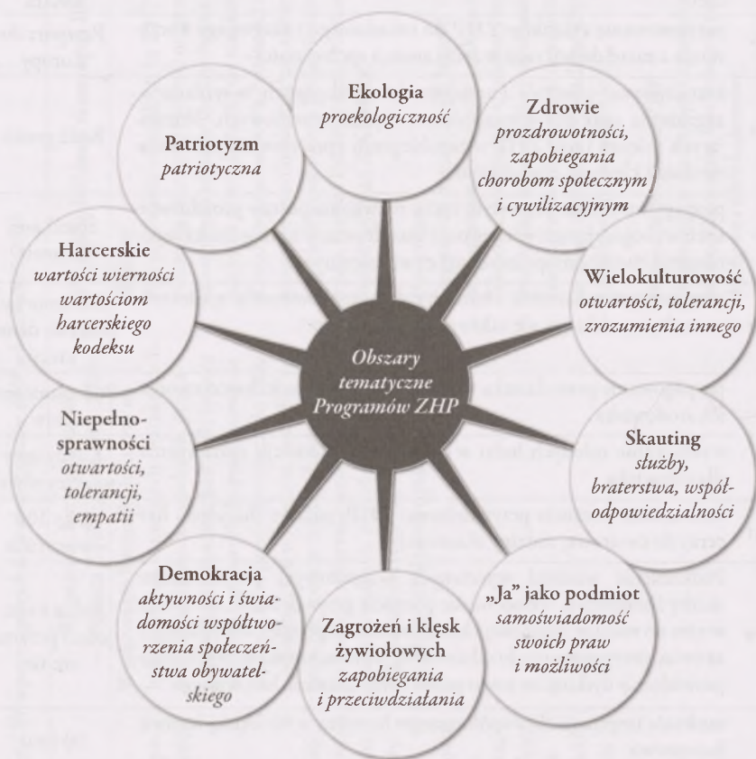
Rysunek 2. Obszary tematyczne Programów ZHP w latach 1995-2008

Pogrubione – obszary edukacji; kursywa – postawy jakie zamierzano wypracować. Źródło: opracowanie własne