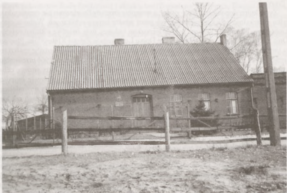
Ryc. 3. Szkoła Podstawowa w Janiej Górze

Prace dydaktyczne prowadzone przez szkoły w Gminie Świąkatowo realizowane były w dwóch formach. Pierwsza dotyczyła kształcenia młodzieży szkolnej, druga zaś oświaty dla dorosłych. Ta ostatnia forma realizowana w systemie wieczorowym obejmowała kursy II stopnia oraz kursy Przynależności Rolniczego i Wojskowego. Kształcenie dorosłych pełniło istotną rolę, gdyż swoim zasięgiem obejmowało analfabetów i półanalfabetów. Na przykład w 1947. r. na tzw. kursach II stopnia (kształcenie w zakresie IV klas) naukę pobierały w Suchej - 54 osoby, Janiej Górze - 19, Zalesiu Królewskim - 33 i Tuszytach - 31 osób. Tego typu działalność oświatowa w krótkim czasie ograniczyła liczbę analfabetów. Według danych z 1949 r. na terenie gminy Świąkatowo znajdowało się 51 analfabetów i 16 półanalfabetów. Aby ostatecznie rozwiązać ten