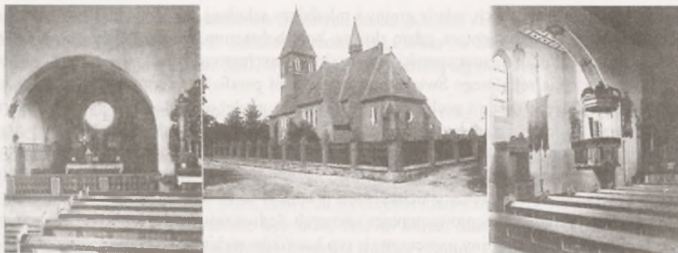
Ryc. 4. Kościół katolicki w Świekatowie przed wybuchem II wojny światowej