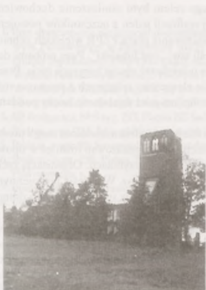
Ryc. 5. Widok zniszczonego kościoła z 1945 r.