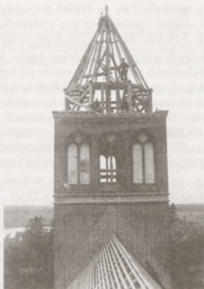
Ryc. 6. Kościół w czasie odbudowy. Zdjęcie z 1947 r.