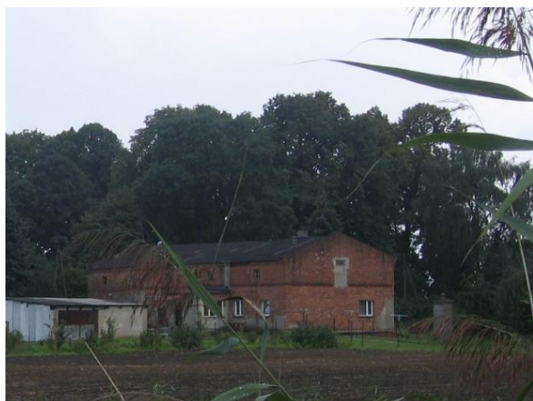
Ryc. 4. Budynek dawnej owczarni (widok od strony północnozachodniej).

Postępujący rozwój Boluminka objawiający się pozytywnymi zmianami na terenie wsi oraz w kościele i parafii przerwała II wojny światowa. W wyniku niej wieś utraciła swoje dotychczasowe znaczenie. Swojej działalności nie wznowiła po 1945 r. szkoła, w wyniku, czego jej budynek nadal był wynajmowany, przez co zostało dokonanych wiele zmian w jej wyglądzie. Podobny los spotkał owczarnię (ryc. 4) i jeden budynek czworaków (ryc. 5). Drugie czworaki zostały rozebrane. Z przedwojennych instytucji przetrwał jedynie kościół wraz z organistówką. Niestety kościół w czasie wojny został ograbiony z dokumentów oraz kosztowności (Świetlik, 2003).