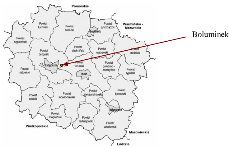
Ryc. 1. Położenie wsi Boluminek na mapie województwa kujawsko-pomorskiego i gminy Dąbrowa Chełmińska.

Położenie geograficzne Boluminka określają współrzędne 53°09'40"N i 18°17'59"E wskazujące, że leży on po prawej stronie Wisły na wysokości około 90 m n.p.m. połodowcowej wysoczyzny morenowej o strukturze pagórkowato-falistej (Podgórski, 1999). Ponadto z tej lokalizacji wynika, że jego obszar zajmuje zachodnią część ziemi chełmińskiej, czyli regionu historyczno-etnograficznego charakteryzującego się różnorodnymi losami.