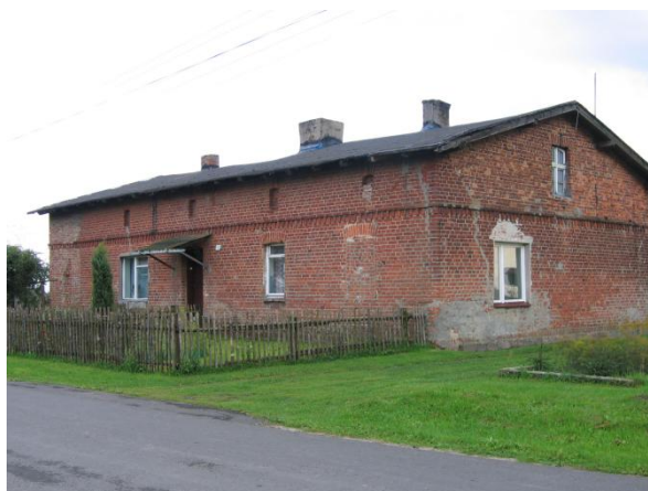
Ryc. 5. Budynek dawnych czworaków (widok od strony północnozachodniej).

Zarówno okres wojny, jak i okres powojenny wpłynęły na społeczność tej wsi. Jej ludność doświadczyła prześladowania i trudnej sytuacji materialnej. W konsekwencji tego większość właścicieli wyjechała z Boluminka, a na ich miejsce przybyli nowi mieszkańcy pochodzący z różnych części Polski. W latach 1945-1989 zmieniło się znaczenie Kościoła Katolickiego w Polsce, a tym samym i rola proboszcza kościoła w Boluminku, któremu utrudniano świadczenia posługi duszpasterskiej (Świetlik, 2003). Pomimo trudności, jakie doświadczała społeczność parafii w połowie tego wieku dokonano wielu inwestycji na terenie wsi związanych z kościołem, mianowicie zmieniono bryłę kościoła (1967) dobudowując kruchą boczną (ryc. 6) oraz wybudowano organistówkę (1964-1968)