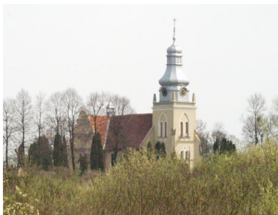
Ryc. 6. Kościół w Boluminku (widok od strony północnozachodniej).

Dopiero pod koniec wieku wraz z ze zmianami, jakie nastąpiły w kraju powrócono do naturalnej roli parafii, jako wspólnoty wiernych skupionych wokół Kościoła. Przyczyniło się do tego unormowanie relacji pomiędzy Kościołem a władzą świecką w roku 1993 w formie podpisanego konkordatu. W wyniku tego koniec XX wieku przejawiał się także odbudową infrastruktury kościelnej, co również było widoczne w Boluminku. Przeprowadzono wówczas w tej wsi liczne remonty oraz prace konserwacyjne i porządkowe dotyczące obiektów parafii, rozebrano resztki szopy, wybudowano kostnicę (1991 r.) oraz budynek gospodarczy (w nim wikariatka – 1992-1993 r. itp. (Sprawozdanie za..., 2006). Poza tym zmiany rozwojowe następowały w demografii Boluminka, polegające na przyroście liczby ludności tej wsi.