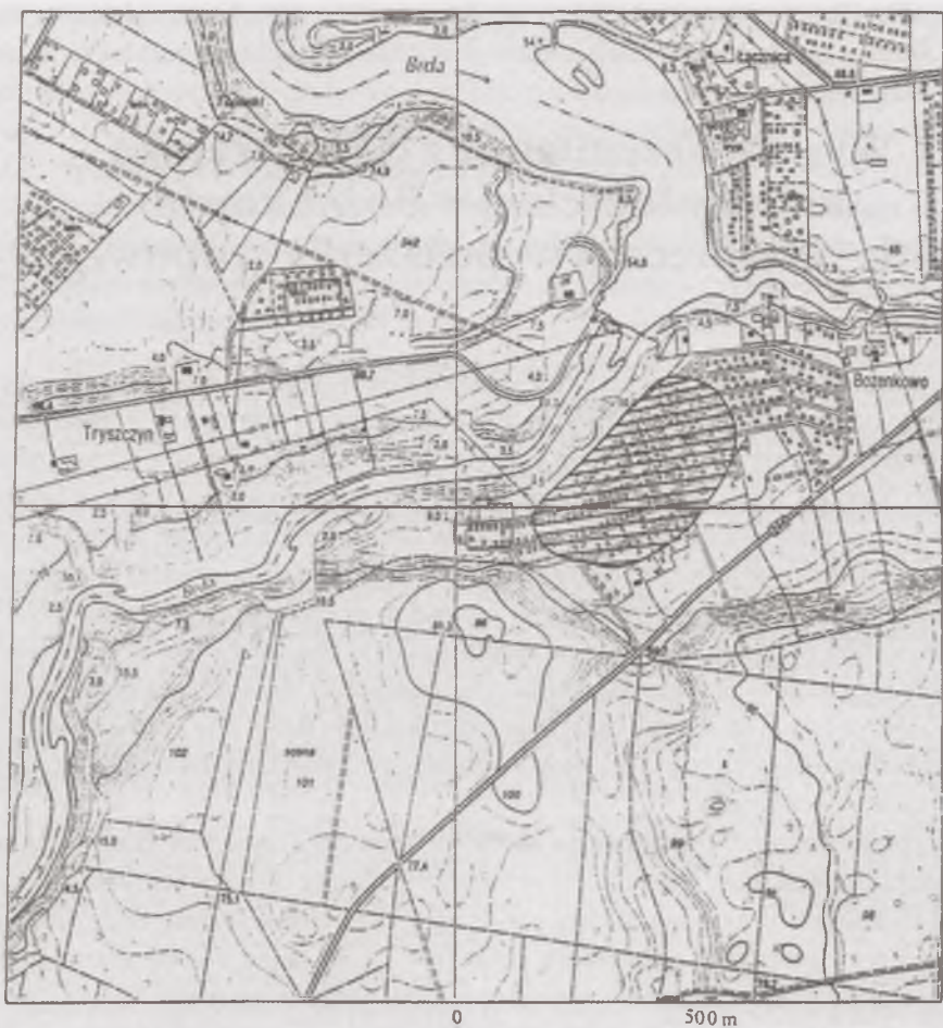
Ryc. 1. Położenie cmentarzyska kultury łużyckiej w Bożenkowie, gm. Osielsko, pow. Bydgoszcz, stan. 1 (oznaczone zakreskowaniem)

Eksploracja stanowiska archeologicznego w Bożenkowie prowadzona była przez mgr. J. Zegarlińskiego z Muzeum Okręgowego w Bydgoszczy podczas kilku sezonów badawczych od 1980 do 1988 roku. Badania ratownicze wiązały się z rozbudową kompleksu wypoczynkowego nad Brdą. Proces ten obecnie uległ powstrzymaniu, jednak stanowisko pokryła w tym czasie architektura ogródków działkowych. Na cmentarzysku ciałopalnym kultury łużyckiej w Bożenkowie odsłonięto ogółem 70 grobów popielnicowych o różnych konstrukcjach. Kilka z nich przykrytych było brukiem kamiennym, występowały groby obsypane resztkami stosu ciałopalnego oraz wkopywane bezpośrednio w calec