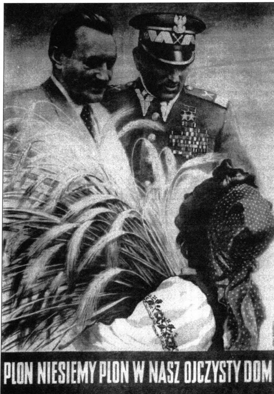
L. Jagodziński, Plon niesiemy, plon... , 1952