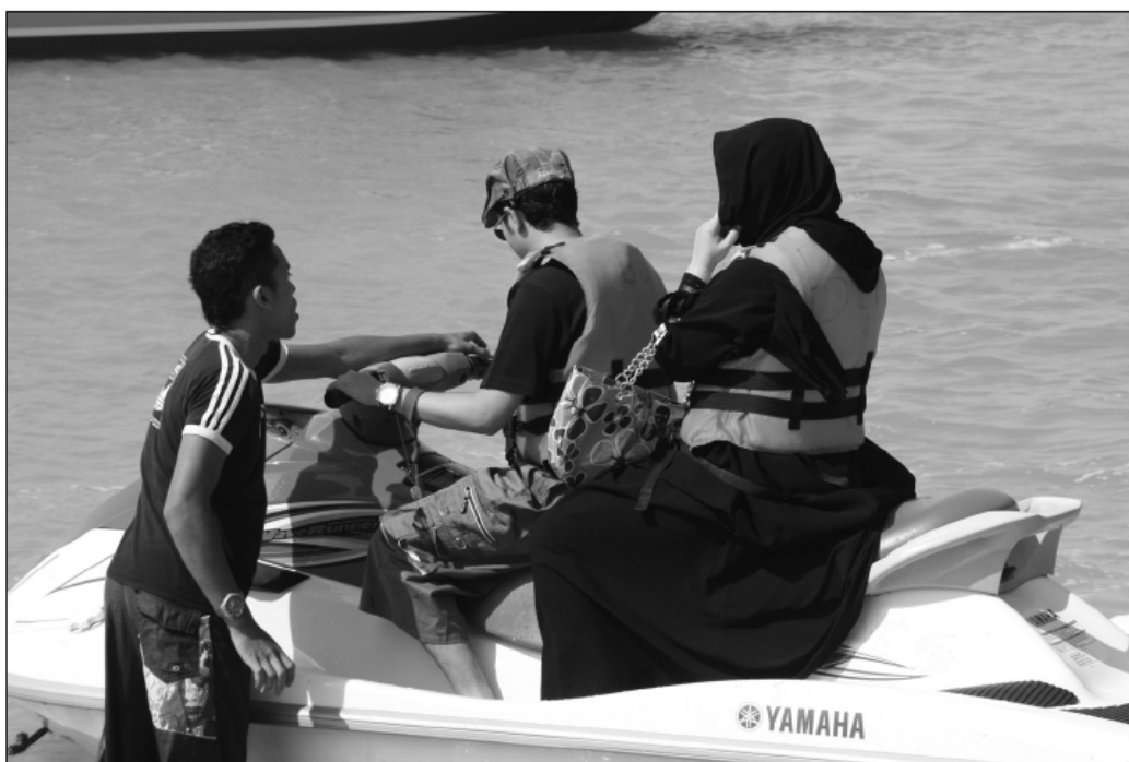
Fot. 1 a-b. Turyści z Arabii Saudyjskiej w Penang (Malezja)