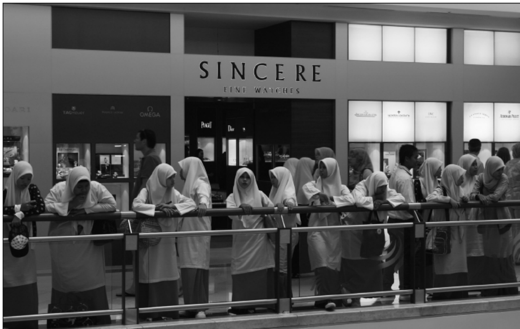
Fot. 3. Centrum handlowe w Kuala Lumpur (Malezja)