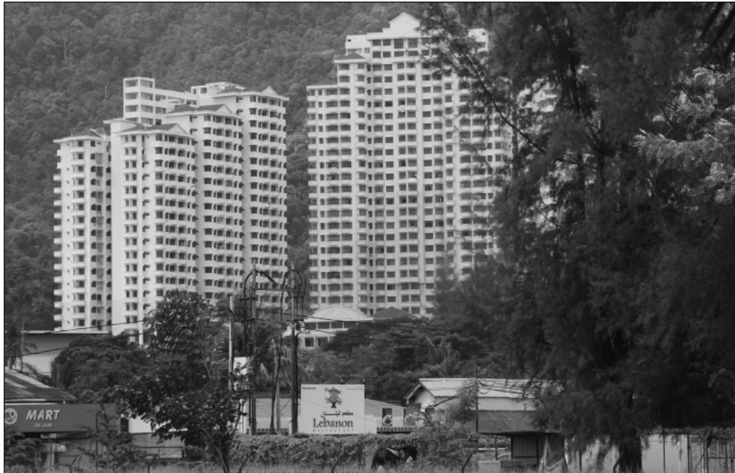
Fot. 2. Infrastruktura hotelowa w Penang (Malezja)