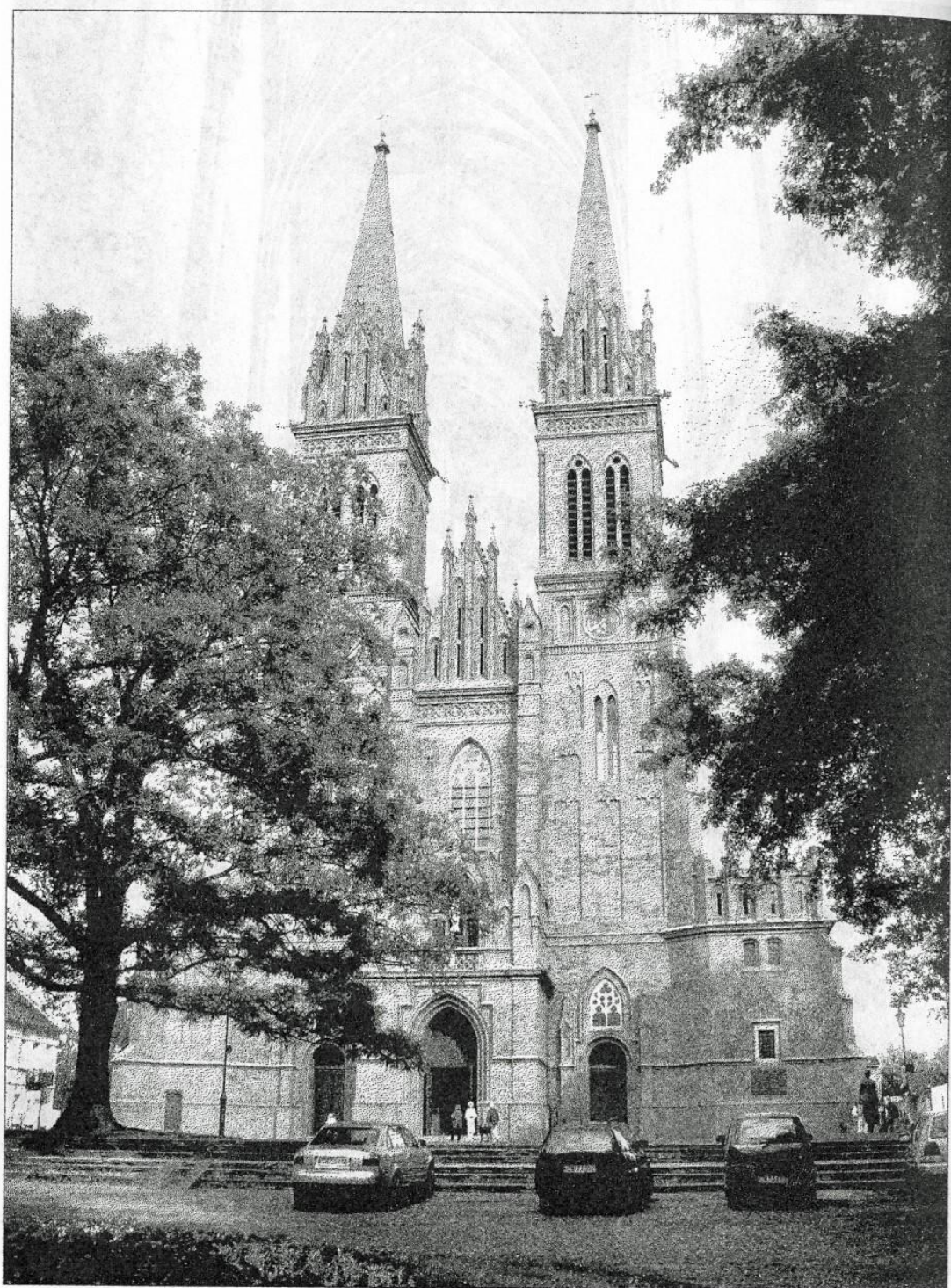
Katedra we Wrocławku, 2010 r.