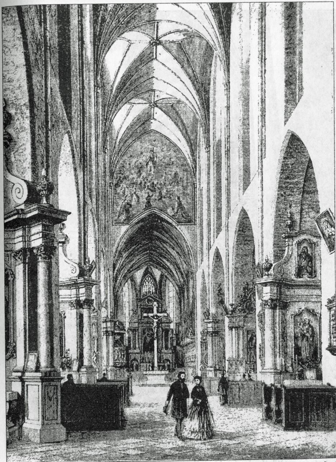
Wnętrze katedry we Włocławku, 1869 r., rys. A. Kozarski, ryt. F. Zabłocki, drzeworyt, [w:] A. Wimiarski, Historia placu katedralnego we Włocławku, Włocławek 2001, s. 23