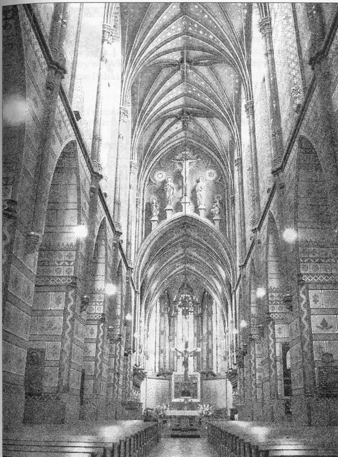
Wnętrze katedry we Włocławku, fot. B. M. Gawęcka, 2010 r.