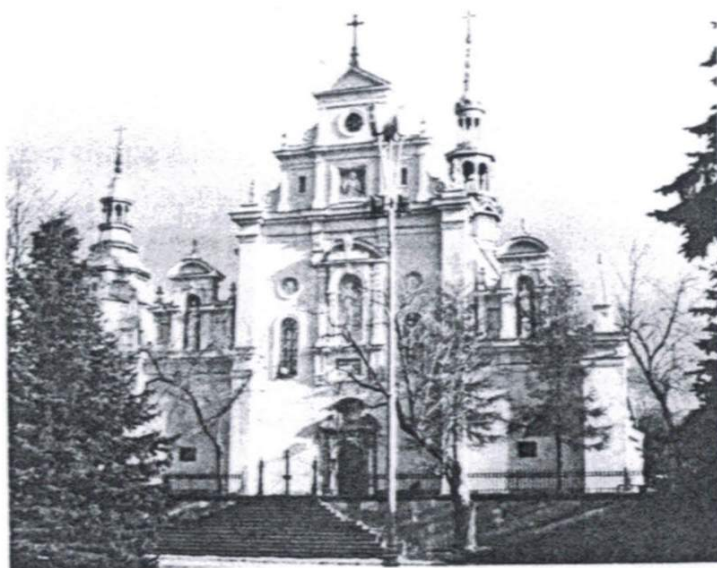
Il. 2. Fasada zachodnia katedry w Kielcach, ok. 1869 r., fot. Barbara Maria Gawęcka, 2009

serves that the bas relief presenting St. Joseph with the child Jesus, found on the Eastern façade of the church, is mistakenly attributed to F. Cengler. She presents documents which may confirm the authorship of L. Marconi. The elaboration is mainly based on the archives and publications as well as magazine articles from the beginning of the 20 th century. The author shortly presents the art of F.K. Kowalski and F. Cengler which is not connected with the Kielce cathedral.