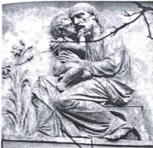
Il. 3. Święty Józef z Dzieciątkiem Jezus, ok.1870 r., fasada wschodnia katedry w Kielcach