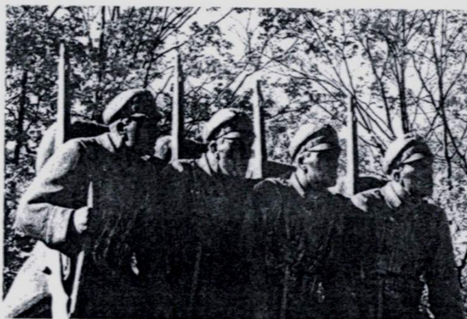
Il. 6. Pomnik Czynu Legionowego w Kielcach, fragment, 2012 r.