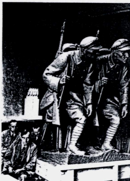
Il. 2. J. Raszka i jego rzeźba „Czwórka”, w tle makieta pomnika Czynu Legionowego w Kielcach, 1937 rok, kopia cyfrowa ze zbiorów APK, SKOPCL, sygn. 5, fot. 23.

przysłał projekt Pomnika Legionów do Kielc. Był on wykonany w skali 1:20. Cokół zrobiono z gipsu, zaś rzeźba „Czwórki” w plastelinie 17 . W kolejnym liście do wojewody z 18 października 1937 rzeźbiarz informował o kosztach inwestycji. Cena modelu „Czwórki” sporządzonego w glinie i odlanego w gipsie o wymiarach 2 m 40 cm x 2 m 40 cm x 1 m 20 cm, wynosiła 40 000 zł. Tyleż samo kosztować miał odlew w brązie tej samej wielkości. Natomiast cokół z kamienia wraz z innymi wydatkami miał zostać wykonany za 20 000 zł. Cały posąg, zdaniem rzeźbiarza, miał kosztować 100 000 zł. Na sporządzenie modelu „Czwórki” i odlewu w gipsie artysta potrzebował dziewięciu miesięcy, zaś siedmiu miesięcy żądała firma, która miała zrobić odlew w brązie. Jak dalej pisze Raszka: Pomnik Legionów wysokości 10 metrów da się wykonać w granicach przewidzianych kosztów. Co zaś do czasu, to w brązie mógłby być odsłonięty dopiero w roku 1939. W roku 1938 mógłby zaś być odsłonięty tylko w ten sposób, żeby się na cokole ustawiło Czwórkę odlaną w gipsie a imitowaną na brąz, jak to zrobiłem swego czasu - ja już dwa pomniki tak odstawiałem. W każdym razie musiałbym się do wielkiego modelu zabrać możliwie zaraz i najuprzejmiej proszę o łaskawe zarządzenie by mi fotografie i pomiary Placu i Gmachu P.W. przesłano możliwie rychło 18 .