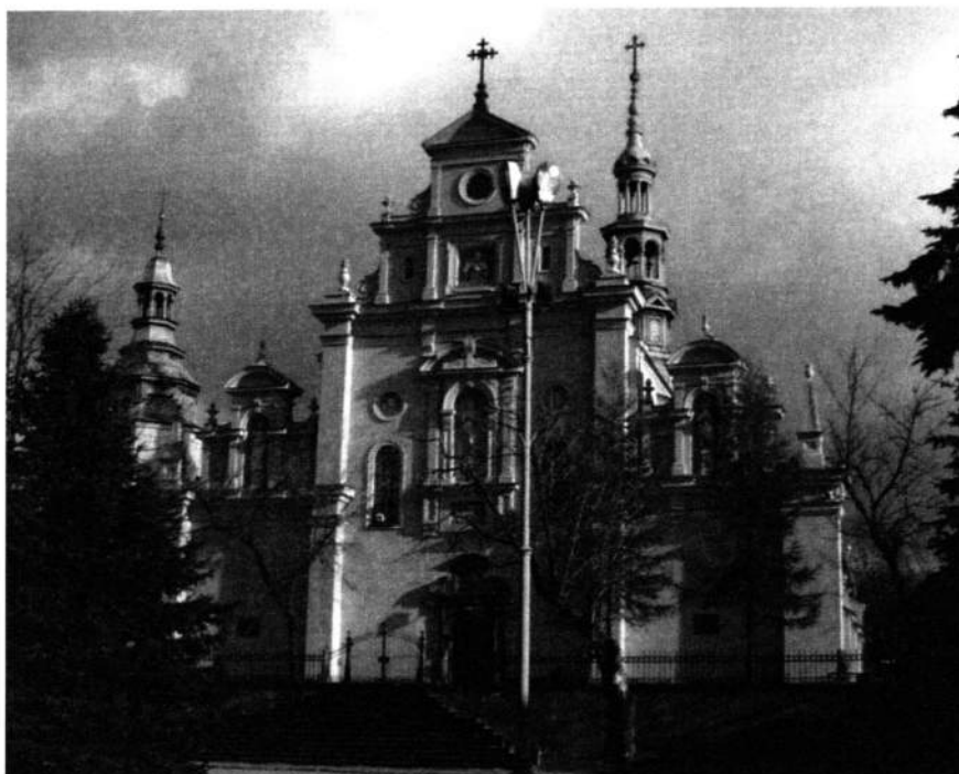
Fot. 2. Fasada katedry kieleckiej, fot. B. M. Gawęcka, 2007 r.