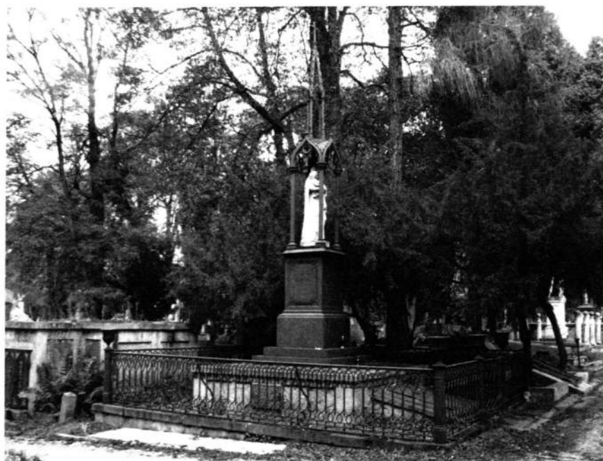
Fot. 1. Nagrobek Franciszka Ksawerego Kowalskiego na Cmentarzu Starym w Kielcach, fot. B. M. Gawęcka, 2010 r.

Keywords: the architecture of the second half of the nineteenth century, restoration of works of art.