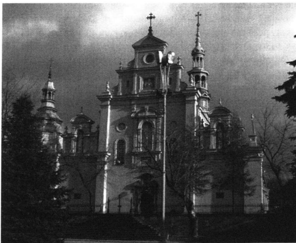
Fot. 2. Fasada katedry kieleckiej, 2007 r.

Architekt wykonał szereg prac dla Kościoła katolickiego. Najważniejszą z nich była przebudowa dzisiejszej katedry kieleckiej, dokonana w latach 1869–1872, gdzie zaprojektował m.in. fasady i sygnaturkę kościoła [fot. 2].