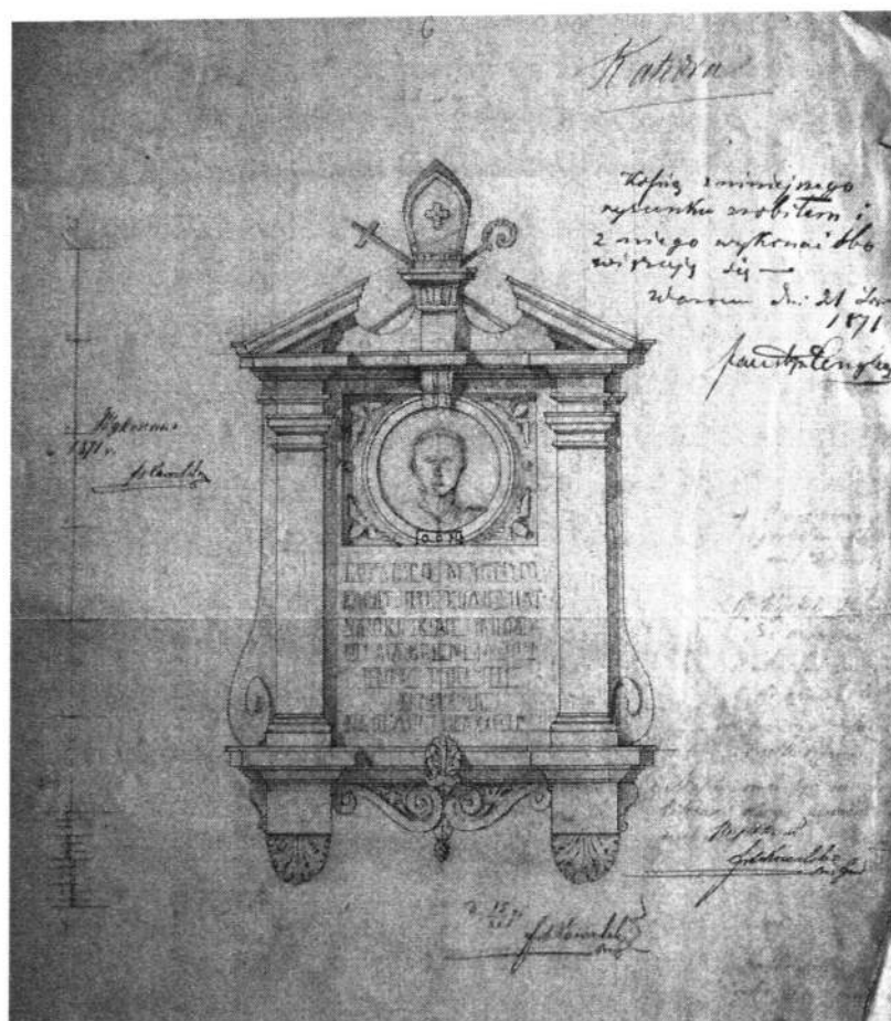
Ryc. 2. Projekt epitafium ks. bp. Macieja Majerczaka.

Architekt zajmował się również projektowaniem epitafiów. Po śmierci bp. Macieja Majerczaka w 1871 r. wykonał rysunek jego epitafium [ryc. 2]. Zostało ono wykonane przez Faustyna Cenglera 61 . Dziś znajduje się w północnej nawie katedry kieleckiej. Franciszek Kowalski zaprojektował także płytę upamiętniającą kanonika Józefa Ćwiklińskiego 62 .