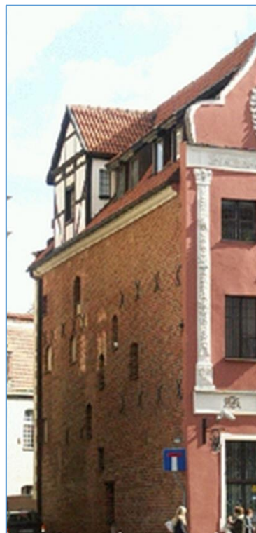
Рис. 4. Вікна на бічній стіні будинку на вул. Хелмінській, 26

до міста дерев'яними трубами з передмістя, яке сьогодні має назву Беляни. Воду можна було черпати з колодязів, які зазвичай розташовані на вигинах вулиць [2, с. 123]. Ймовірно, багатші жителі Торуні підвели водогін прямо до центру прибуткового будинку, як це було в інших великих містах того періоду (наприклад, у Гданську) [21, с. 155].