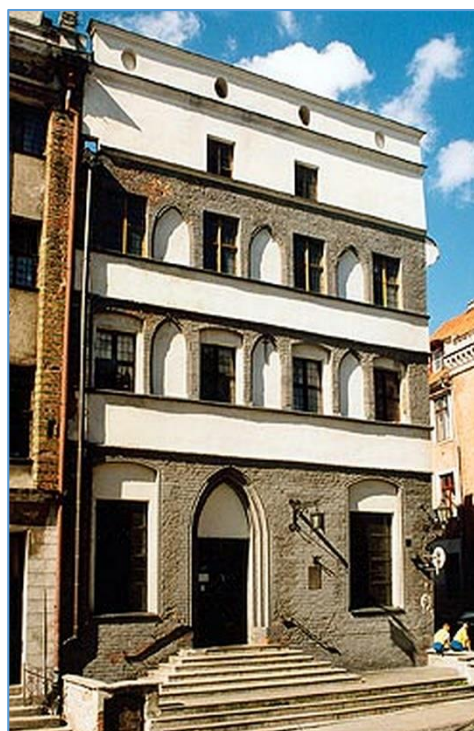
Рис. 5. Ганок багатоквартирного будинку на вул. Жегларська 7

тераси шириною 3–4 м та висотою 2 м. На терасу вели широкі сходи. Рівень ганку був на рівні першого поверху. Прикладом може бути ганок на