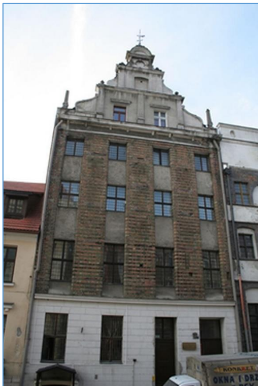
Рис. 3. Викладка із декоративного кирпича – вул. Жегларська 5/6