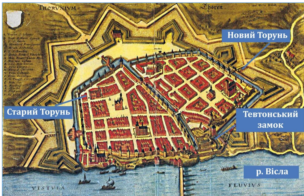
Рис. 1. План Торуні за Матеушу Меріану 1641 г.

р. Вісли, за дві милі вниз за течією від острова Лиска, що перекривається з територією нинішнього Старого Міста Торунь. На жаль, незважаючи на археологічні дослідження, жодних слідів первісного поселення виявлено не було.