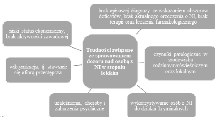
Rycina 1. Trudności związane ze sprawowaniem dozoru nad osobą z NI w stopniu lekkim

Na podstawie analizy i interpretacji zebranego materiału badawczego wyłoniłam następujące obszary, które kuratorzy sądowi powiązali z trudnościami związanymi ze sprawowaniem dozoru nad osobą niepełnosprawną intelektualnie w stopniu lekkim (Rycina 1).