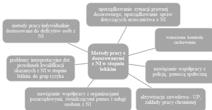
Rycina 2. Metodyka pracy z dozorowanymi z NI w stopniu lekkim

Metodyka pracy kuratora sądowego w środowisku życia skazanych nazywana jest ca-sework. Sprowadza się ona do zindywidualizowanych oddziaływań o charakterze wychowawczo-resocjalizacyjnym, diagnostycznym, profilaktycznym i kontrolnym (art. 1 ustawy o kuratorach sądowych), przy zachowaniu podmiotowości podopiecznych. Dóbr metod pracy jest zależny od kompetencji kuratorów i założeń przyjętej teorii oraz koncepcji resocjalizacji (Rycina 2).