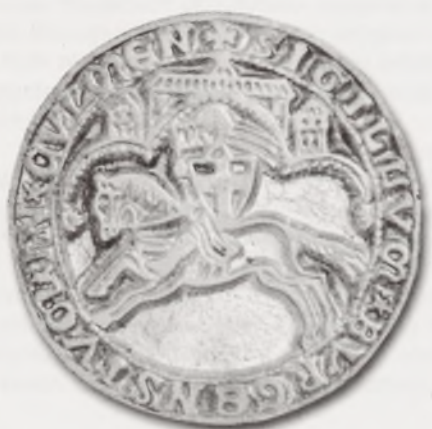
Kopia najstarszej, wielkiej pieczęci Chełmna z XIII w. (?). (Zbiory Muzeum Ziemi Chełmińskiej)

Na temat chełmińskiego herbu historycy milczeli aż do połowy XIX wieku, kiedy to głos zabrał berliński numizmatyk Fryderyk August Vossberg 3 . Nie zajmował się on bezpośrednio herbem Chełmna, gdyż jego specjalnością była sfragistyka. Ponieważ jednak na pieczęciach miejskich umieszczano zwykle godła w sposób nie zamierzony wszczął dyskusję wokół herbu miasta. Odnalazł on pieczęć miejską fundowaną być może wkrótce po lokacji miasta w 1233, lub, co bardziej prawdopodobne, po odnowieniu przywileju w 1251 roku. Ta uszkodzona pieczęć zawierała napis: + SIGILLVM + BVRGENSI[VM + IN + CVL]MEN, a jej średnica wynosiła aż 85 mm. Znajdowała się na dokumencie z 1345 roku 4 . Przedstawiała rycerza umieszczonego pod potrójną arkadą, siedzącego na koniu pędzącym w lewo, przysłoniętego tarczą z krzyżem i trzymającego w prawej ręce proporzec o trzech poprzecznych pasach. Nad arkadami, pośrodku umieszczony był szeroki budynek, flankowany przez dwie wieże. Z rysunku Vossberga trudno wnioskować co w zasadzie widniało na chorągwi. A jest