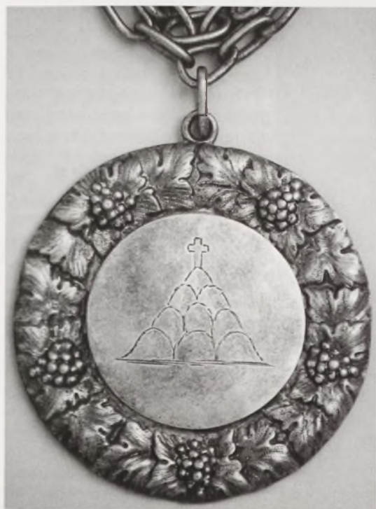
Odnazka Bractwa Strzeleckiego z 1882 r.