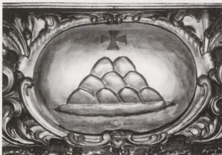
Herb Chełmna z ołtarza Matki Bożej Bolesnej w fary chełmińskiej (1699 r.)

Podobny układ pagórków występuje w herbie widniejącym na ołtarzu Matki Bożej Bolesnej z Kaplicy Cudownego Obrazu fary chełmińskiej fundowanym w 1699 roku. Herb