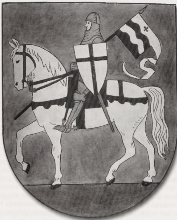
Projekt herbu Chełmna z okresu II wojny światowej. (Zbiory Muzeum Ziemi Chełmińskiej)

W okresie okupacji hitlerowskiej został przywrócony herb z Krzyżakiem na koniu. Projekt nowego herbu wykonano w 1942 roku. Według tego projektu wykonano następnie nowe pieczęcie z napisem: SIEGEL DER STADT KULM. Mimo wcześniejszych sugestii otrzymanych z Królewca i Gdańska, by na proporcu dzierzonym przez jeźdźca umieścić dziewięć wzgórz z krzyżem, ostatecznie zdecydowano się na powielenie motywu z chorągwi grunwaldzkiej z krzyżem rycerskim zwieszonym ponad obniżeniem górnego pasa. 51 Po zakończeniu wojny od tego symbolu definitywnie odstąpiono. Po dzień dzisiejszy w odczuciu miejscowej opinii publicznej kojarzy się on z uciskiem i utratą niepod-