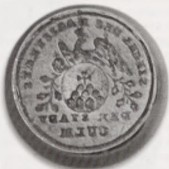
Tłok pieczętny Magistratu Miasta Chełmna z okresu po 1815 r. (?).