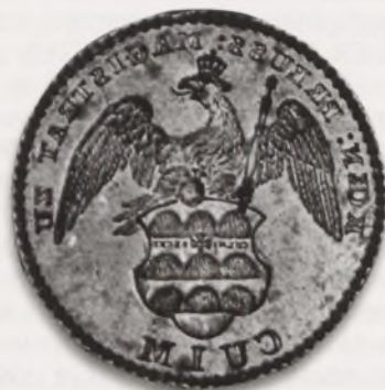
Tłok pieczętny z herbem miasta na renesansowej tarczy, koniec XVIII w. (?). (Zbiory Muzeum Ziemi Chełmińskiej)

Widzimy go na pięknej pieczęci płatkowej z 1803 r. w jednej z ksiąg hipotecznych 29 . Pagórki występują w układzie 3:3:3. Równoramienny krzyż umieszczono na środkowym pagórku środkowego rzędu. Wzniesienia