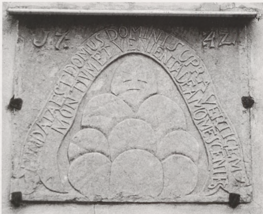
Herb Chelмна na fasadzie kościoła w Szynychu z 1747 r.