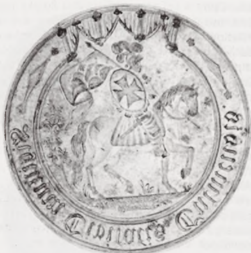
Wielka pieczęć Chełmna z końca XIX wieku. (Zbiory Muzeum Ziemi Chełmińskiej) Fot. M.G. Zieliński