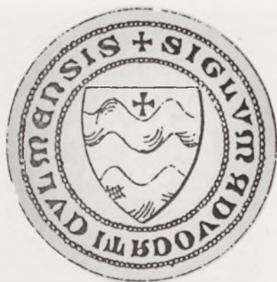
Pieczęć wójta chełmińskiego rezydującego w Lipienku z pocz. XV wieku, wg B. Engla

Druga, w przeciwieństwie do pierwszej, bardzo dobrze zachowana, również o średnicy 29 mm, przedstawia dwa, bardzo mocno wyartykułowane, pasy sinusoidalne z krzyżem w zagłębieniu górnego pasa. Napis w otoku brzmi: + sigillum advocati colmensis . Tę woskową pieczęć przywieszono przy dokumencie z 1450 roku. Engel wskazał także na trzy średniowieczne, opłatkowe pieczęcie przedstawiające herb na pismach wystawionych przez Radę Miasta. Pierwsza, o średnicy 19 mm występuje na dokumencie z 1481 r. i ma herb o trzech rzędach potrójnych wybrzuszeń, bez krzyża 8 . Druga, o średnicy 20 mm, występująca na dokumencie z 31 stycznia 1484 r. prezentuje herb o czterech rzędach sinusoidalnych, również bez krzyża 9 . Trzecia, o średnicy 22 mm, z trzema rzędami wybrzuszeń i krzyżem greckim na grzbiecie środkowym znana jest z dokumentu z 24 lutego 1488 roku 10 .