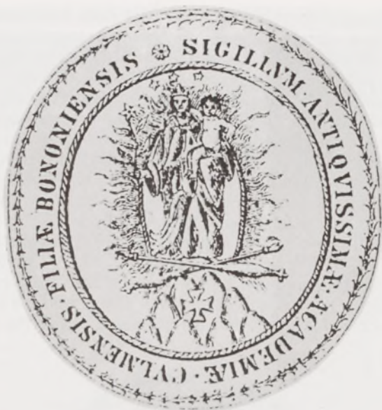
Pieczęć Akademii Chełmińskiej z ok. 1692 r.