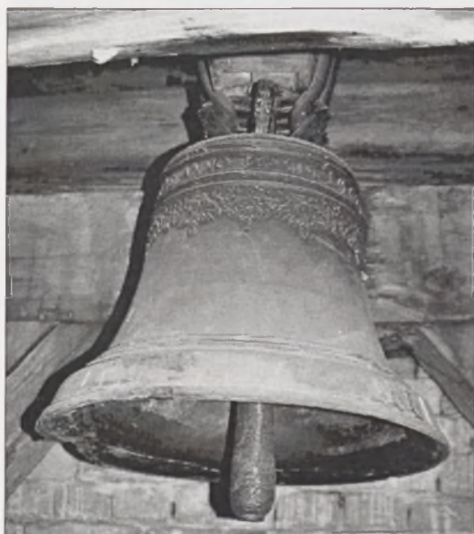
Il. 5. Starogród, dzwon z 1668 roku zdobiony ornamentem girlandowym.