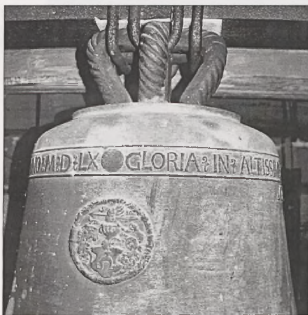
Il. 2. Lisewo, dzwon z 1560 roku, fragment inskrypcji i herb Dąbrowa rodziny Kostków – fundatorów dzwonu.