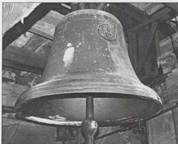
Il. 1. Lisewo, dzwon z 1560 roku, odlany w gdańskiej ludwisarni Gerharða Benningka.