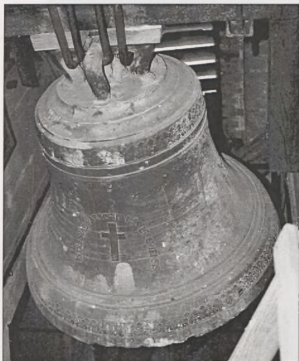
Il. 3. Lisewo, dzwon średniowieczny.