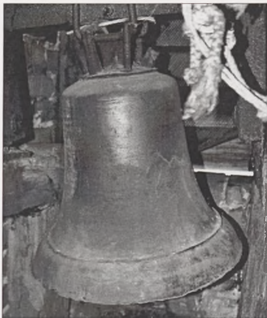
Il. 4. Lisewo, dzwon odlany w 1829 roku w Królewcu przez Ludwika Copinusa. Fot. Marek G. Zieliński