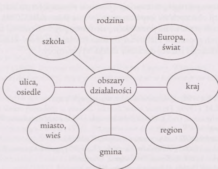
Rycina 1. Obszary działalności jednostek harcerskich realizujących programy ZHP (za: Marszałek 2009)