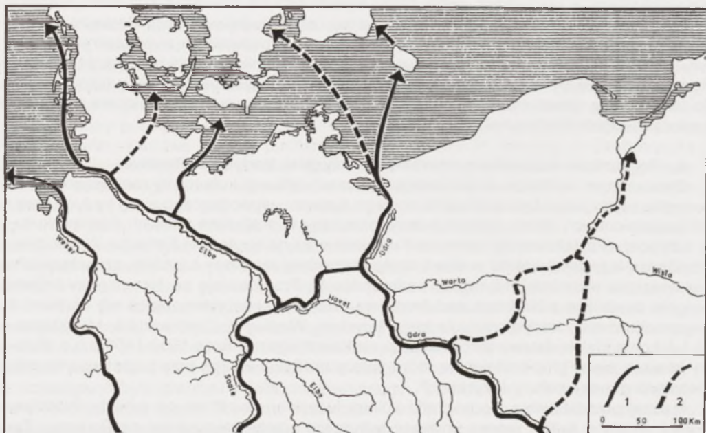
Przebieg szlaków handlowych na przełomie epoki brązu i okresu halsztackiego na ziemiach polskich, według Z. Bukowskiego, Pomorze w epoce brązu w świetle dalekosiężnych kontaktów wymiennych , Gdańsk 1998, s. 359 (1 – prawdopodobny przebieg, 2 – przypuszczalny przebieg) Repr. J. Woźny

Renesans kontaktów handlowych pomiędzy południem Europy, w tym głównie Kotliną Karpacką i Transdanubią, a Pomorzem Wschodnim zaznaczył się na przełomie młodszych faz epoki brązu oraz wczesnej epoki żelaza 52 . Towarzyszyło temu procesowi kształtowanie się bardziej ustabilizowanych form osadniczych, znamionujące powstanie grupy kaszubskiej kultury łużyckiej. Osadnictwo pogranicza kujawsko-pomorskiego uległo również rozbudowie, jednak jak sądzi Z. Bukowski, szczególnie pomiędzy Bydgoszczą a Świeciem łączyło się ono z wpływami grupy chełmińskiej, nie zaś z tradycją wschodnio-pomorską oraz kujawską 53 . Według W. Szafraniego obecność ozdób o cechach „wschod-