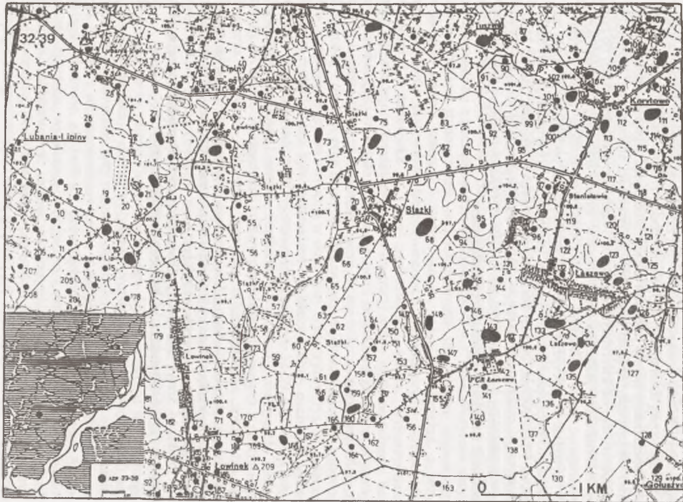
Rys.1. Sieć osadnicza w rejonie wsi Łowinek, Korytowo, Lubania-Lipiny