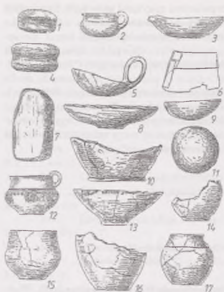
Ryc. 5. Wyroby kamienne w robie kultury lużyckiej z Czarnkowa (1,4 – kamienie żłobkowe; 7 – ośelka piaskowcowa; 11 – gładzik kamienny; 2,3,5,8-10,12-17 – naczynia; 6 – przedmiot metalowy) (wg Łuka 1950, s. 61)

ośelki kamienne leżały w grobach, jednak nie znajdowano ich zazwyczaj we wnętrzu samych popielnic, wśród szczątków ciałaopalenia. Prawdopodobnie analogiczne zależności dotyczą pochówków z okresu przedrzymskiego i rzymskiego, gdzie bliżej szczątków ciałaopalenia znajdowały się części gładziki kamienne i otoczaki. Ośelki natomiast leżały zarówno na uboczu (np. Sadowie, pow. ostrowski – JASNOSZ 1955), jak też we wnętrzu popielnic (np. Młodzikowo, pow. Środa – DYMACZEWSKI 1958). W każdym wypadku należy przypuszczać o ich ważnej symbolicznej roli w trakcie obrzędów pogrzebowych.