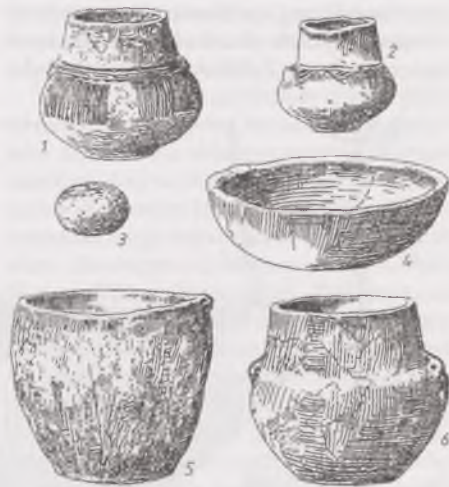
Ryc. 3. Gładzik kamienny w grobie kultury łużyckiej z miejscowości Cieśle Wielkie, pow. wrzesiński (1-6: naczynia; 3-gładzik)

również przeworskiej (BALKE 1976, s. 194) gładziki kamienne w formie otoczek interpretowano jako wyróżnik wyposażenia żeńskiego, z racji zajęć wykonywanych przez kobiety przy produkcji wyrobów garncarskich (ryc. 3). Z kolei akceptowana w archeologii teoria społecznego podziału pracy w pradziejach przekonuje, że proces powstawania przedmiotów metalowych pozostawał pod nadzorem mężczyźn, w ramach początków specjalizacji zawodowych (DĄBROWSKI 1977). Zgodnie z zasadą traktowania wyposażenia grobowego jako wskaźnika życiowej profesji zmarłych, zarówno „Rillensteine” w kulturach pól popielnicowych (ryc. 4), jak też późniejsze piaskowcowe oselki w okresie lateńskim i rzymskim, łączone są z garniturem wyposażenia męskiego (BLONBERGOWA 1972, s. 202). Proste kryteria selekcji prowadzą do przejrzystych rezultatów badawczych, pozwalających wydzielić groby kobiet – garncarek z gładzikami otoczkowymi oraz pochówki mężczyźn – metalurgów i kowali