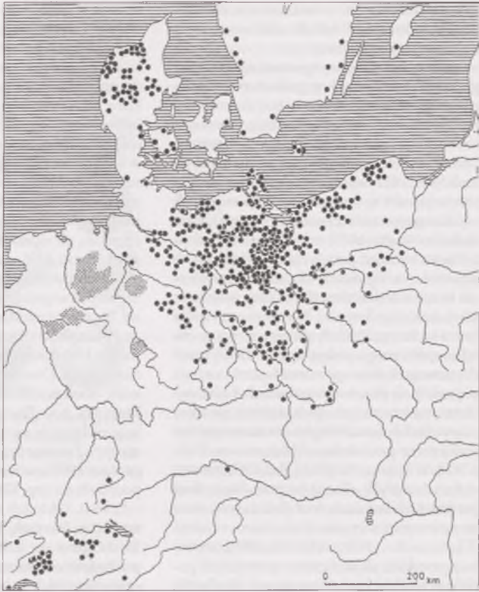
Ryc. 2. Rozmieszczenie znalezisk kamieni żłobko- wanych na stanowiskach z epoki brązu (wg Horst 1986, s. 83)

również przeworskiej (BALKE 1976, s. 194) gładziki kamienne w formie otoczek interpretowano jako wyróżnik wyposażenia żeńskiego, z racji zajęć wykonywanych przez kobiety przy produkcji wyrobów garncarskich (ryc. 3). Z kolei akceptowana w archeologii teoria społecznego podziału pracy w pradziejach przekonuje, że proces powstawania przedmiotów metalowych pozostawał pod nadzorem mężczyźn, w ramach początków specjalizacji zawodowych (DĄBROWSKI 1977). Zgodnie z zasadą traktowania wyposażenia grobowego jako wskaźnika życiowej profesji zmarłych, zarówno „Rillensteine” w kulturach pól popielnicowych (ryc. 4), jak też późniejsze piaskowcowe oselki w okresie lateńskim i rzymskim, łączone są z garniturem wyposażenia męskiego (BLONBERGOWA 1972, s. 202). Proste kryteria selekcji prowadzą do przejrzystych rezultatów badawczych, pozwalających wydzielić groby kobiet – garncarek z gładzikami otoczkowymi oraz pochówki mężczyźn – metalurgów i kowali