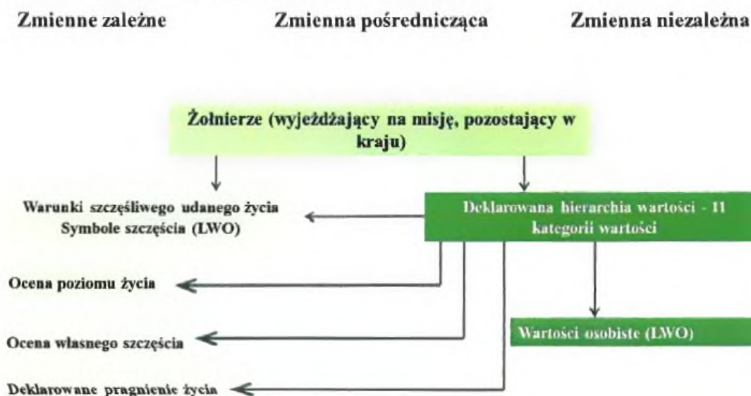
Rys. 1. Założony układ zmiennych

W badaniu przyjęto określony układ zmiennych (rys. 1).