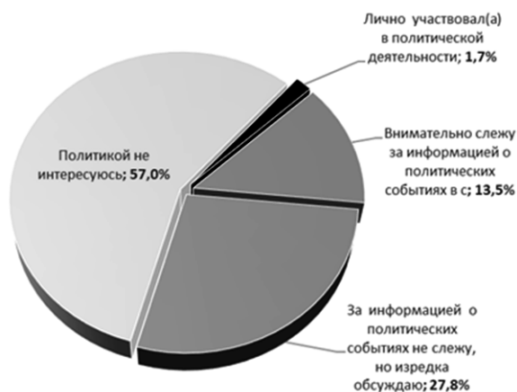
Рисунок 1. Степень интереса казахстанской молодежи к политике, N=1000