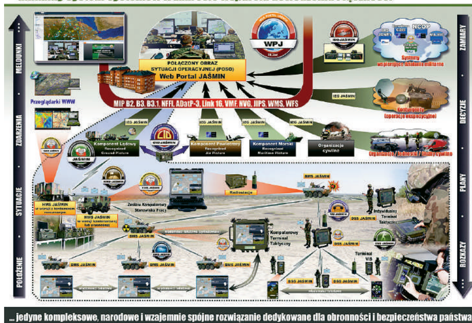
Rysunek 2. Schemat Sieciocentrycznej Platformy Teleinformatycznej (SPT) C4ISR* JAŚMIN

* C4ISR – Command, Control, Communications, Computers, Intelligence, Surveillance and Reconnaissance. Por. AAP-6 (2014) PL – Słownik terminów i definicji NATO.