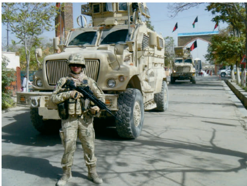
Fotografia 1. Pojazd o zwiększonej odporności na improwizowane ładunki wybuchowe typu MRAP użytkowany przez PKW w Afganistanie na podstawie umowy ACSA*