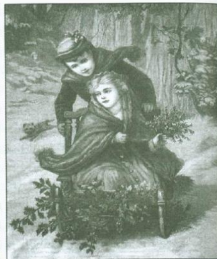
Wśród uroczego lata , „Światło” 1888, nr 8 (po lewej) Rozrywki zimowe . Podług obrazu K. Brocharta, „Tygodnik Ilustrowany” 1881, nr 274 (po prawej)

mamy czy opiekunki możnych dzieci jednak niechętnie wypuszczały pociechy na zimno, obawiając się przeziębień czy odmrożeń. Dzieci z rodzin najuboższych, szczególnie młodsze, często nie miały cieplej odzieży czy butów, by w takich zabawach uczestniczyć.