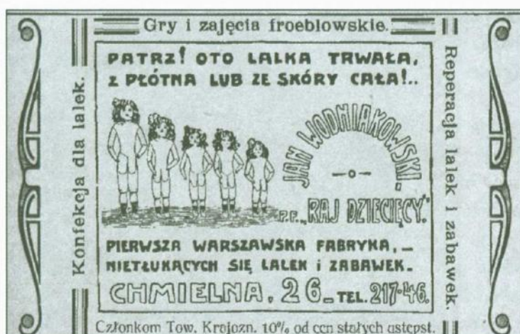
Na grafice: reklama warszawskiej fabryki lalek i zabawek, „Ziemia” Tygodnik Krajoznawczy Ilustrowany, Warszawa-Lwów 1914, nr 23)