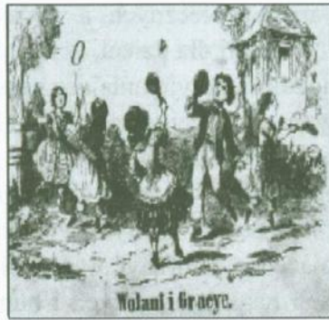
Wolani i Graeye.