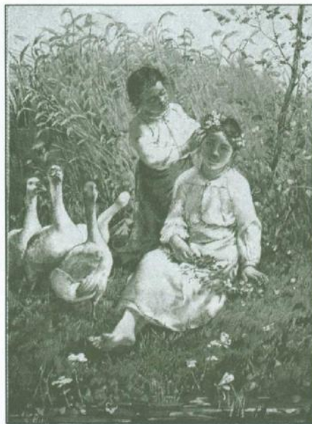
Na grafice – zabawa dziewcząt w wianki podczas pasania gęsi, W niedzielę , Rys. K. Pochwalskiego, „Tygodnik Ilustrowany” 1886, nr 18