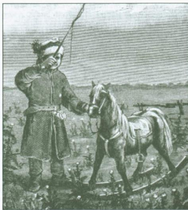
Zabawy konikiem na kij i płozach oraz biczykiem, „Mody Paryzkie” 1882, nr 6 (po lewej)