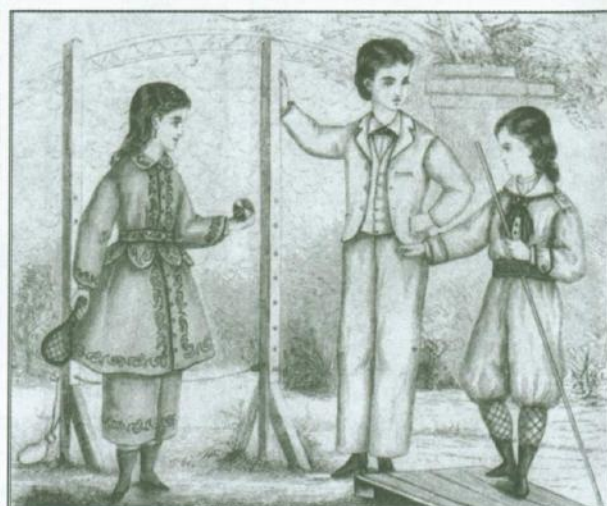
Z życia dworu wiejskiego. Gimnastyka pokojowa, „Kłosy” 1893, nr 423 (po lewej) Ubrania do gimnastyki dla dziewczynek i chłopców od 6 do 12 lat, „Bluszcz” 1870, nr 24 (po prawej)