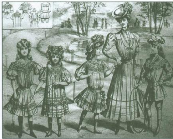
Ubrania dziecinne od 3 do 13 lat, „Tygodnik Mód” 1868, nr 27 (po lewej) Stroje dla dziewczynek od 8 do 12 lat, „Tygodnik Mód” 1885 (po prawej)

stwa 14 . Lecz bywały i takie kinderbale, podczas których do tańca przygrywała nie matka czy nauczycielka, ale prawdziwa orkiestra, na których dzieci, ubrane w stroje według najnowszych żurnali mód jadły i piły sprowadzane z zagranicy frykasy, a zabawa przeciągała się długo w noc. Oczywiście były one domeną najmożniejszych warstw społecznych. Dużo częstsze bywały sytuacje, że tańczono także w mniejszym gronie, składającym się z rodziców i dzieci, rezydentów czy gości dworu, zaś salą balową była bawialnia czy nawet korytarz. Najmłodsi sami chętnie organizowali zabawy w bal, naśladując przy tym dorosłych.