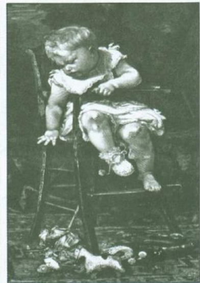
Zabawy najmłodszych dzieci Wielkie nadzieje (z albumu pociech rodzinnych ), „Biesiada Literacka” 1878, nr 120 (po lewej) Męki Tantara . Rysunek z obrazu T. Lobrichona, „Tygodnik Ilustrowany” 1890, nr 50 (po prawej)