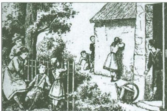
Zabawa w chowanego, w: M. Weryho, Gry i zabawy towarzyskie w pokoju i na dworze , Warszawa 1900

indywidualne, dla jednego dziecka, jak i grupowe, dla kilkorga dzieci. W poradnikach zawierano szereg wskazówek metodycznych, przedstawiając pomysły na zabawy i gry ruchowe, umysłowe, swobodne, bez przyrządów, lub z wykorzystaniem różnych zabawek czy sprzętów. Zabawy zwykle publiczności dzielili zabawy na dwa rodzaje – pokojowe i odbywane na świeżym powietrzu. Wśród nich były zajęcia wymagające przedmiotów i zabawek niezbędnych do gry, lub też takie, w których dzieci wykonywały jakieś czynności bez tzw. przyrządów. Każda z zabaw czy gier była zwykle dokładnie opisana, autorzy wyjaśniali reguły i zasady ich przeprowadzenia, określali warunki niezbędne do realizacji zabawy, wiek i liczbę uczestników, wskazywali na niezbędne pomoce i przyrządy. W niektórych poradnikach wskazywano także na pochodzenie i historię danej zabawy, a jej charakterystykę uzupełniały ilustrujące ją grafiki. Nie brakowało też na rynku wydawniczym pozycji, które wskazywały, jak wykonywać w warunkach domowych, przy użyciu powszechnie dostępnych materiałów i sprzętów proste doświadczenia i sztuczki magiczne. Zabawy wykonywane z pomocą tego typu wydawnictw, pod okiem opiekuna, z pewnością nie tylko bawiły, ale miały też wymiar kształcący – dziecko poznawało podstawowe prawa fizyki, chemii czy innych nauk 17 .