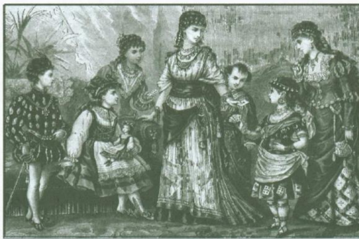
Zabawa w bal, Dzień grzecznego Władzia w rymowanych ustępach opowiedziany dzieciwie z dodatkiem różnych wierszyków przez Jana Chęcińskiego , Warszawa 1867 (po lewej) Wzory kostiumów balowych dla dzieci i młodzieży, „Bluszcz” 1876, nr 45 (po prawej)