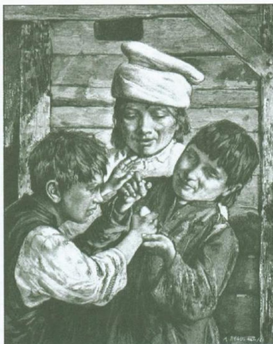
Gwiazdka , „Biesiada Literacka” 1886, nr 52 (po lewej)