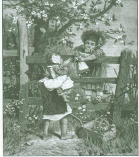
Wspólna zabawa dzieci ziemiańskich i chłopskich Bańki mydlane , rys. E. Perle, ryt. E. Gorazdowski, „Kłosy” 1876, nr 45 (po lewej) Na płocie , rys. J. Konopacki, „Kłosy” 1885, nr 1054 (po prawej)