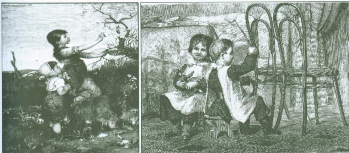
Kwiecie wiosenne , podług obrazu Kajzera, „Tygodnik Ilustrowany” 1888, nr 74 (po lewej) Jazda!... , kopia obrazu J. Maszyńskiego, „Tygodnik Ilustrowany” 1875, nr 386 (po prawej)

Przestrzeń zabaw znacznie rozszerzała się poza domem, na świeżym powietrzu. Dla dzieci chłopskich był to zwykle teren wiejskiej zagrody, okolicznych pól, łąk czy lasów. Podobnie było z dziećmi z rodzin ziemiańskich czy arystokratycznych, dla których teren dworu, pałacu i jego okolicy był niezwykle atrakcyjnym polem dla organizacji zabaw (z wyjątkiem tych dzieci, których nadopiekuńczy rodzice, bony czy guwernantki zabraniały niczym nieograniczonych swawoli). Jeszcze inaczej wyglądała przestrzeń zabaw dobrze sytuowanych dzieci w mieście, które wolny czas mogły spędzać w ogrodach zakładanych przy miejskich willach lub kamienicach, lub w ogrodach i parkach miejskich. Maluchy z rodzin robotniczych bawiły się na podwórkach kamienic, na ulicach, w rynsztokach, na cmentarzach.