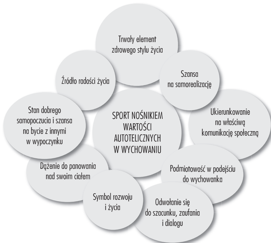
Rysunek 3. Sport i jego znaczenie dla wychowania