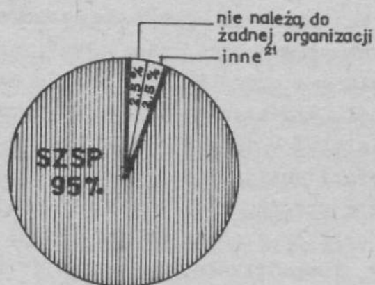
2. wg ankiet

Wobec tak wyraźnej przewagi przynależności do SZSP można badać stosunek do organizacji na przykładzie stosunku do tej organizacji. Ankietowani zresztą, indagowani na temat działalności i stosunku do niej, wypowiedzieli się właśnie na temat SZSP.