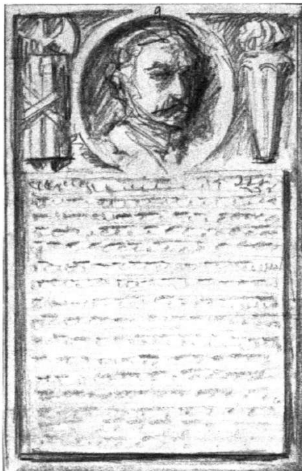
Fot. 2. Projekt tablicy upamiętniającej Stefana Łaszewskiego autorstwa Marcina Rożka, przesłany do zatwierdzenia wojewodzie pomorskiemu 7 III 1925 r. APB, UWP w Toruniu, sygn. 7, k. 9

malnie 2700 zł. W ramach zaliczki wypłacono Rożkowi 1000 zł. Następna rata, tej samej wysokości, miała zostać przekazana po wykonaniu modelu z gipsu, reszta zaś po zakończeniu prac 15 . W Archiwum Państwowym w Bydgoszczy zachowała się korespondencja Marcina Rożka z wojewodą, dotycząca wykonania tablicy upamiętniającej Stefana Łaszewskiego 16 . W liście z dnia 7 marca 1925 r. rzeźbiarz pisał: