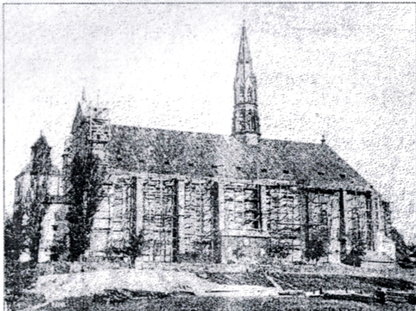
2. Katedra w Sandomierzu w czasie prac w latach 1886–1889, fotografia Marcin Kasiewicz, ok. 1890 roku, [w:] ksiądz Józef Rokoszny, Święte pamiątki Sandomierza , Warszawa, 1902, reprint, s. 14

Sygnaturkę zaprojektował Wąsowski, zaś w 1887 roku zobowiązał się ją wykonać Piotr Pilniakowski 10 .