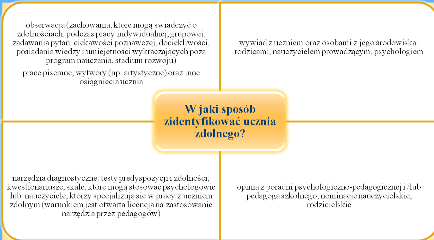
Rysunek 2. Sposoby identyfikacji ucznia zdolnego

Na podst.: Limont, W. (2005). Uczeń zdolny. Jak go rozpoznać i jak z nim pracować . Sopot: Gdańskie Wydawnictwo Psychologiczne