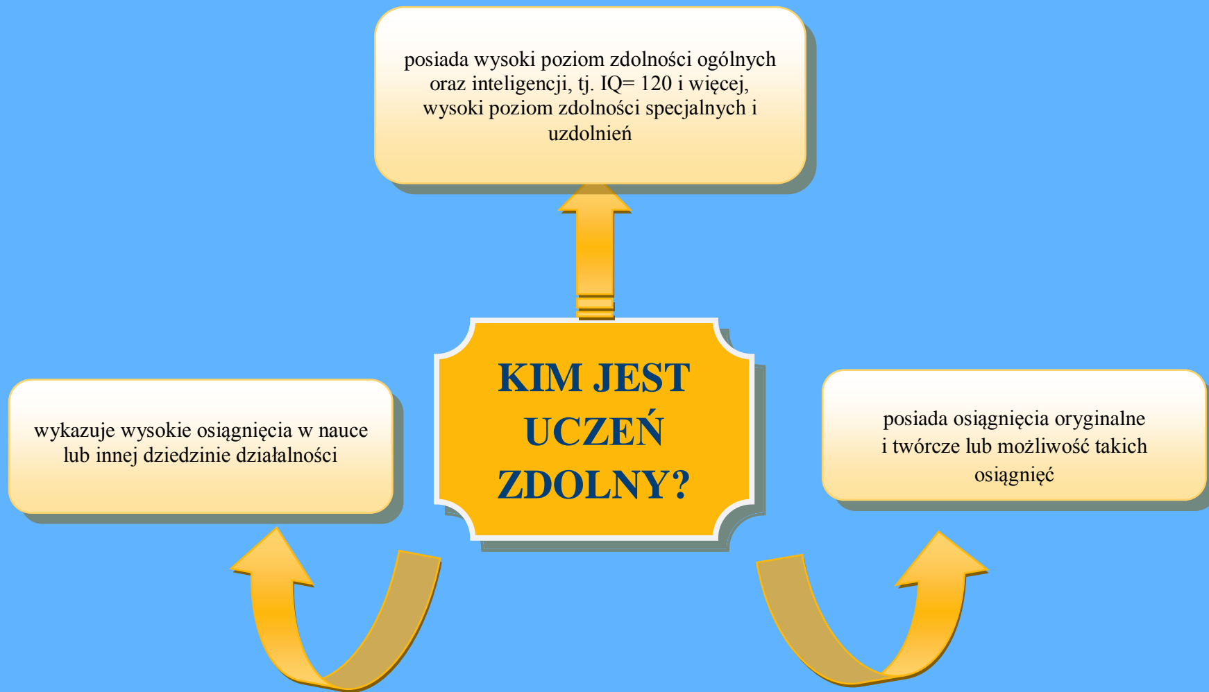
Rysunek 1. Charakterystyka ucznia zdolnego

Na podst.: Szumski, G. (1995). Dobór i kształcenie uczniów zdolnych , WSiP: Warszawa, s.53