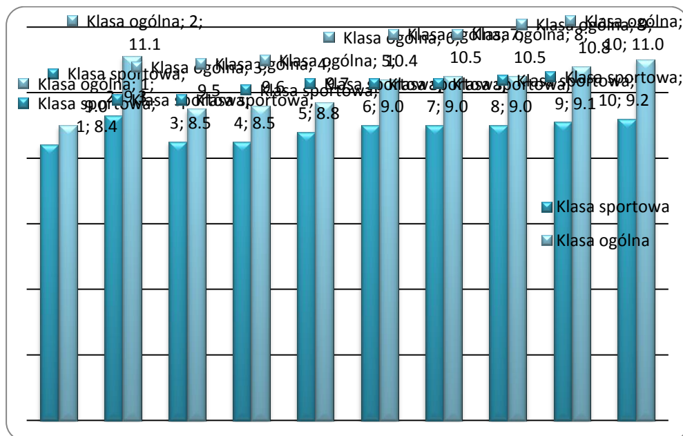
Rys. 1. Bieg na 60 m (s.) – chłopcy - zestawienie uzyskanych wyników

Szczegółowe wyniki uzyskane przez chłopców zostały zebrane i przedstawione na rysunku 2.